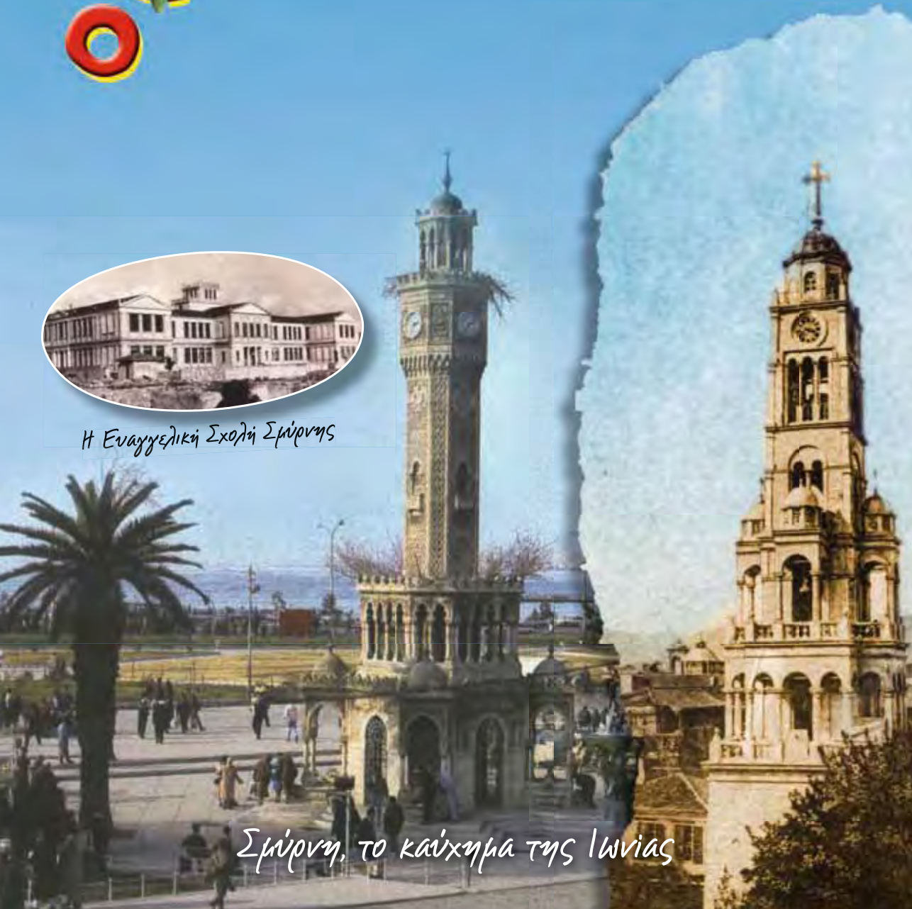
Σμύρνη, το καύχημα της Ιωνίας