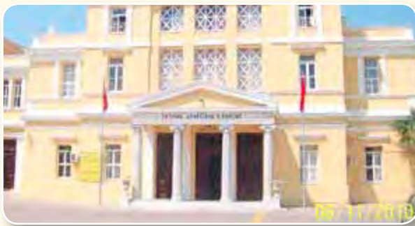
Η Ευαγγελική Σχολή σήμερα: Λύκειο Σμύρνης "ΑΤΑΤΟΥΡΚ"

φορες συνοικίες της Σμύρνης. Το σχολ. έτος 1919-20 οι μαθητές είχαν φτάσει τους 775 και το επόμενο τους 900! Εκεί δίδαξαν περιφημοί δάσκαλοι, όπως ο Θεόφιλος Καΐρης και ο Βενιαμίν ο Λέσβιος. Η ελληνική κοινότητα της Σμύρνης αγκάλιασε το σχολείο της και το συντηρούσε οικονομικά με δωρεές και κληροδοτήματα. Το 1747 η Σχολή τέθηκε κάτω από την προστασία της Αγγλίας, ώστε να προστατεύεται από την τουρκική mania.