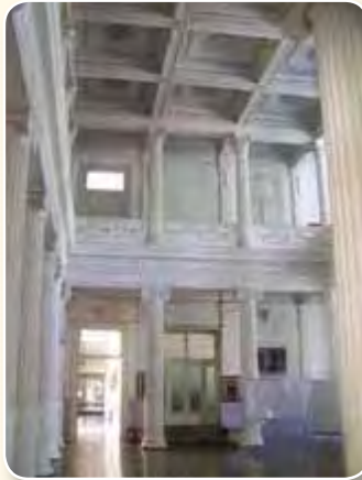
Το εσωτερικό της Σχολής σήμερα