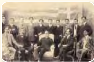
Σμύρνη, 1910. Απόφοιτοι & καθηγητές της Σχολής

Ω στόσο το 1717, με πρωτοβουλία του Μητροπολίτη Σμύρνης Ανανία και των προυχόντων της πόλης ιδρύεται το σχολείο που έμελλε να καταλάβει την πρώτη θέση μεταξύ των υπολοίπων της περιοχής. Το πρώτο του όνομα ήταν Ελληνικόν ή Μεγάλο Σχολείον , αλλά από τις αρχές του 1800 η ονομασία του σταθεροποιείται ως Ευαγγελική Σχολή , αφού σκοπό του είχε να σκορπίζει το φως του Ευαγγελίου του Χριστού (δεν είχε σχέση με τους Ευαγγελικούς Προτεστάντες, που και τότε αλώνιζαν στην υπόδουλη πατρίδα μας). Η Ευαγγελική Σχολή ακολούθησε πορεία δύσκολη αλλά λαμπρή. Σ' αυτήν φοιτούσαν Ελληνόπουλα από τη Μ. Ασία, από τα γύρω νησιά και από όλη την Ανατολή. Ο αριθμός των μαθητών αυξήθηκε τόσο, ώστε δημιουργήθηκαν παραρτήματα της Σχολής σε διά-