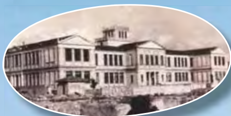
Η Ευαγγελική Σχολή Σμύρνης