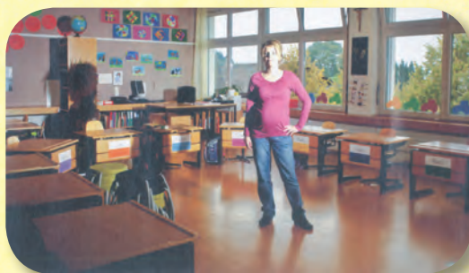
Η τάξη της Β' Δημοτικού στο χωριό Σέηλενμπεργκ.