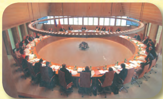
Το Κοινοβούλιο σε ολομέλεια

Ίσως το σημαντικότερο επίτευγμα του Λιχτενστάιν είναι ότι κατάφερε να βγει από τη μαύρη λίστα των παραδείσων για τους φοροφυγάδες. Ο πρόεδρος της κυβέρνησης Κλάους Τσίτσερ έχει παραδεχτεί: «Ήμασταν ένα μαύρο κουτί». Όλα αυτά, όμως, ανήκουν στο παρελθόν.