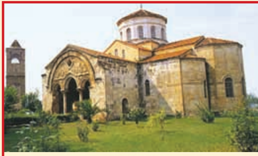
Αγ. Σοφία Τραπεζούντας. Βυζαντινός ναός – μονή, που χτίστηκε από τον αυτοκράτορα Εμμανουήλ Α΄ τον Κομνηνό το 1291.

Α ξιοπαρατήρητο είναι ότι από τον 2ο μέχρι τον 15ο αι. μ. Χ. οι Ιεράρχες του Πόντου ασκούσαν πρωτεύοντα ρόλο στα ζητήματα της Ορθοδόξου Εκκλησίας. Σχεδόν σε όλες τις Οικουμενικές και Τοπικές Συνόδους Επίσκοποι του Πόντου