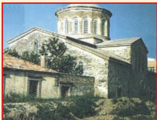
Άγ. Ευγένιος Τραπεζούντας. Βυζαντινός ναός, ένα από τα κυριότερα μνημεία της πόλης. Η εκκλησία λειτουργούσε και ως σχολή, όπου παρέδιδε μαθήματα ο κληρικός-αστρονόμος Γρηγ. Χιονιάδης.

ατηρώντας συνήθως μέσα τους την χριστιανική πίστη.