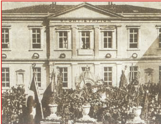
Η τελετή εγκαινίων του "Φροντιστηρίου Τραπεζούντας", 1902.

Ε υεργετικός υπήρξε ο ρόλος της Εκκλησίας στη διατήρηση και ανάπτυξη της Παιδείας. Από τις Εκκλησίες και τα Μοναστήρια ξεκινούσαν τα πρώτα Σχολεία. Παπάδες ή καλόγεροι ήταν οι πρώτοι δάσκαλοι με τα εκκλησιαστικά κείμενα ως βιβλία των μαθητών. Με τις παροτρύνσεις και οδηγί-