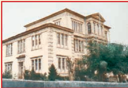
Το Γυμνάσιο της Κερασούντας