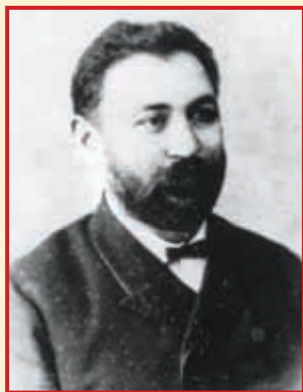
Κωφίδης Ματθαίος: Βουλευτής Τραπεζούντας στην Τουρκική Βουλή. Απαγχονίστηκε στην Αμάσεια τον Σεπτέμβριο του 1921.

στις 738 και το 1911 στις 652. Στον πρακτικό τομέα οι μαθήτριες του Παρθεναγωγείου ασκούσαν, πέραν των θεωρητικών μαθημάτων, και σε εργασίες σχετικές με το σπίτι, όπως κοπτική, ραπτική και οικιακή οικονομία. Μπορούμε να πούμε πως η