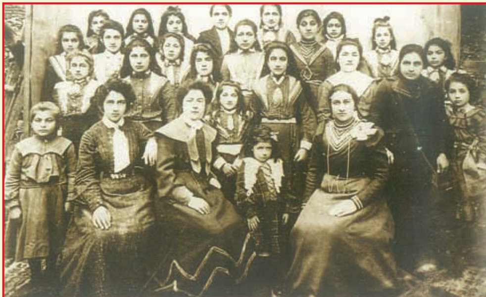
Μαθήτριες και δασκάλες του Παρθεναγωγείου Σινώπης (αρχές 20ού αιώνα)