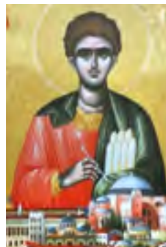
Ο ΑΓΙΟΣ ΚΑΙΣΑΡΙΟΣ