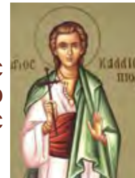
Ο ΑΓΙΟΣ ΚΑΛΛΙΟΠΙΟΣ Ο ΕΣΤΑΥΡΩΜΕΝΟΣ

Ο Άγιος Καισάριος, αδελφός του Αγ. Γρηγορίου του θεολόγου, ήταν ο τελευταίος βλαστός της ευλογημένης του οικογένειας. Γεννήθηκε περί το 330 μ.Χ. στην Ναζιανζό της Καππαδοκίας και κληρονόμησε τις σπάνιες αρετές των αγίων γονέων του.