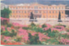
Η ανθισμένη ταρατάσα του υπουργείου Οικονομικών, με θέα τη Βουλή.

ΑΝ ΟΙ ΤΑΡΑΤΣΕΣ ΓΙΝΟΥΝ ΚΗΠΟΙ θα δώσουμε μια πολύ καλή λύση σε σημαντικά προβλήματα της πόλης μας!